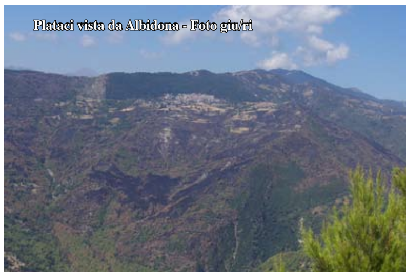
Plataci vista da Albidona

dalle chiamate di soccorso da parte del Sindaco e dei cittadini, me compreso che posso testimoniare il ritardo negli interventi, permettendo al fuoco di distruggere flora e fauna. Infatti i soccorsi si sono, fortemente, procrastinati e, prima di andarsene, non hanno, minimamente, badato a spegnere tutti quei focolai rimasti, che, poi, purtroppo, nella notte con quello scirocco che soffiava, hanno ingenerato ulteriori roghi.