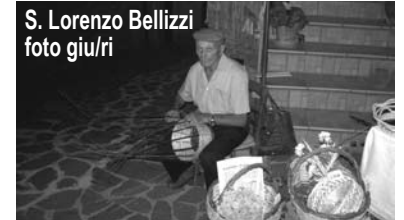
S. Lorenzo Bellizzi