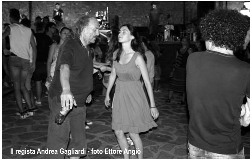
Il regista Andrea Gagliardi

Mentre i suonatori accordano la zampogna, la surdulina e la ciaramella (totarella), siamo scesi nella piazzetta Rossa per seguire la proiezione del documentario Area tammorra di Andrea Gagliardi. Il più bel commento l'abbiamo sentito da due anziani contadini seduti sui gradini, quando hanno visto e sentito il vecchio ortolano campano che diceva "a terra s'a