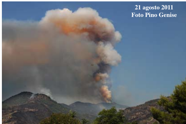
21 agosto 2011

“Abbiamo rischiato di essere bruciati vivi. E' opportuno che si mobiliti tutta la popolazione”