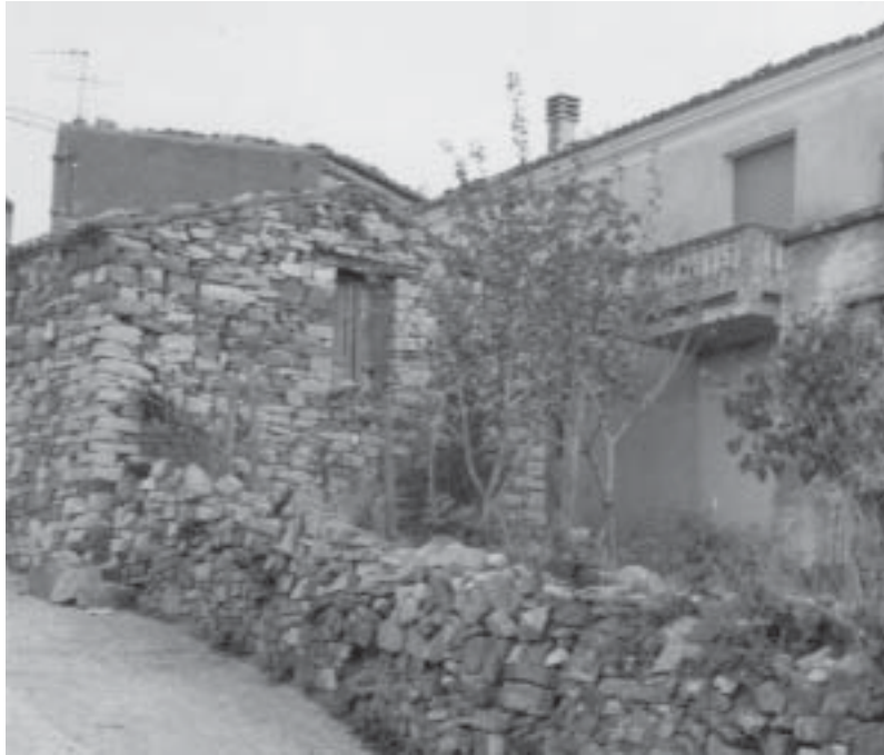
Castroregio - Il vecchio e il nuovo