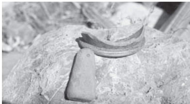
Reperti 1998

Insomma, cosa emerge di importante in questa ultima campagna di scavi di Francavilla? Ecco, anche l'uso didattico di questi lavori archeologici; i reperti ci fanno capire come era strutturata la società di Lagaria: la gente era occupata in tre settori: produttivo, di culto e funerario. Si coltivavano i campi, si producevano cereali, vino e olio, si faceva anche artigia-