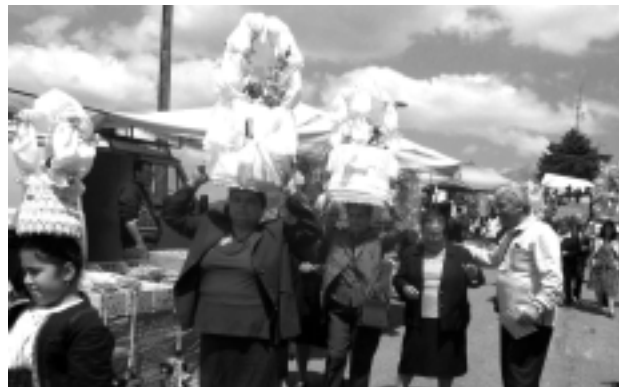
La "cozzarella"

La festa di San Michele del 2009 è stata più ricca e più commovente degli anni precedenti, anche per la statua restaurata da esperti professionisti che l'hanno riportata al suo vecchio splendore. Io ho pregato il capo banda musicale di San Giorgio Albanese di fare tre squilli di tromba, appena San Michele è uscito dalla porta della Chiesa. L'imponente statua ha commosso tutti i fedeli che con le lacrime agli occhi e con i piedi scalzi,