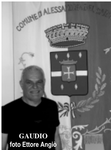
GAUDIO