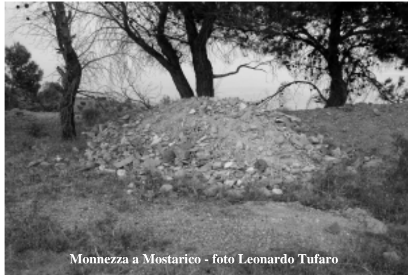
Monnezza a Mostarico

Non voglio assolutamente parlare della recente campagna elettorale e dei risultati delle elezioni europee e amministrative. E nemmeno della guerra dei manifesti, degli spazi imbrattati da tanto spreco di carta. Hanno fatto schifo certe risse trasportate dai paesi alla Marina. Però, un'altra cosa la voglio proprio dire: mia suocera, che ha votato addirittura l'estrema sinistra, è stata fermata dinanzi al seggio; un piccolo rampante l'ha fermata e le ha detto: "ziarè, dallo a me il voto, perché anche io sono di sinistra ma sono per il voto utile". Mia suocera, che ben conosce questa gente, gli ha risposto: "tu cerchi solo la soppressa per casa tua, non te ne frega degli altri". Ora, tutti i candidati trombati dicono: "nata picch, ci ll'avie fatt, ... m'ane mancàte sùle cinquanta voti!". La monnezza la vanno a buttare anche a Mostarico