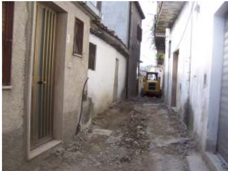
Albidona - Traccia della rete metanifera