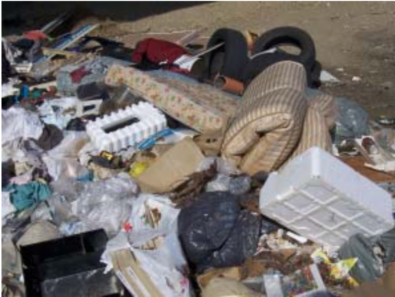
C.da Pagliara