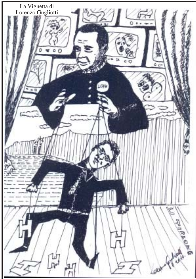
La Vignetta di Lorenzo Gugliotti