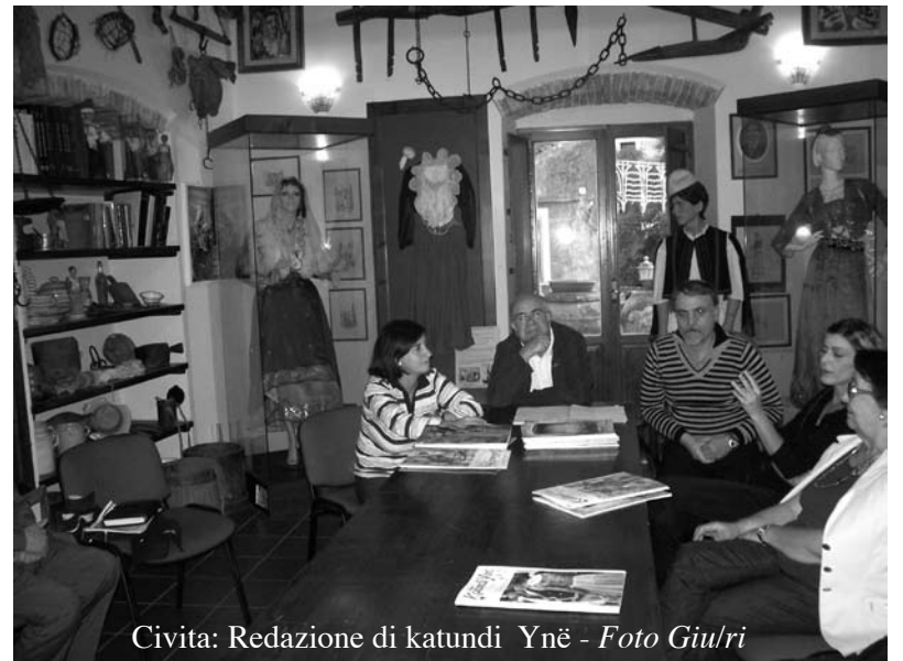
Civita: Redazione di katundi Ynë