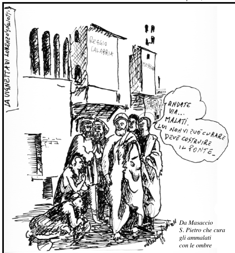
Da Masaccio S. Pietro che cura gli ammalati con le ombre