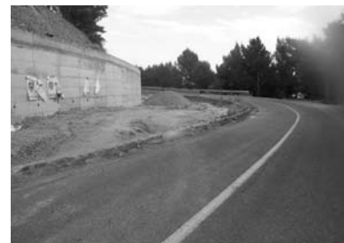
Albidona - Curva Rosaneto