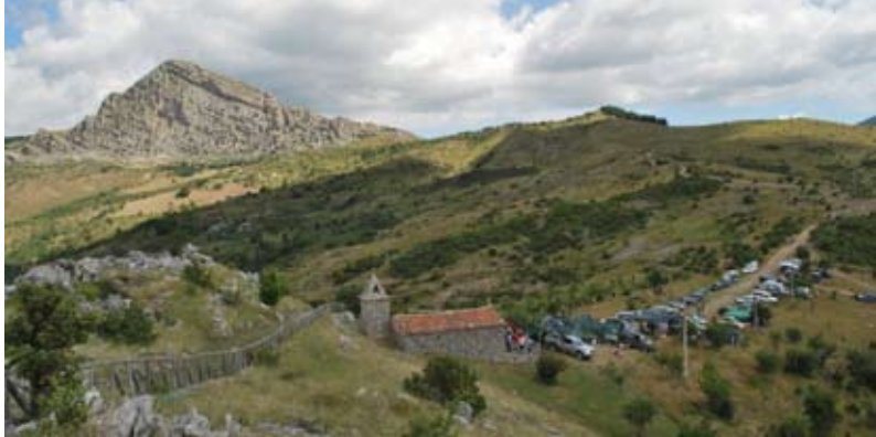
Sant'Anna di S. Lorenzo Bellizzi