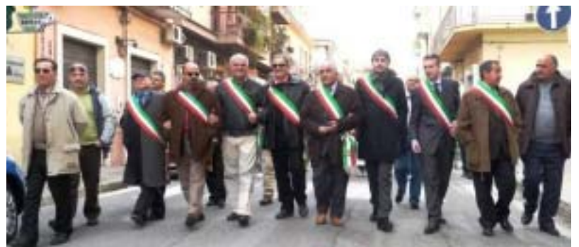
ALCUNI SINDACI...

ha adottato una serie di provvedimenti che sono in stridente contrasto con le promesse, autorizzando un sistematico saccheggio di uomini e di attrezzature al punto che, se anche si dovesse decidere la riapertura dei reparti chiusi, non ci sarebbero più né il personale, né i mezzi per farlo funzionare. Esproprio di attrezzature, trasferimento volontario o coatto di medici e di infermieri verso altre strutture che, oltre ad accaparrarsi personale e mezzi, gonfiano le proprie liste di produzione con i nostri pazienti, anch'essi dirottati in modo coatto verso altri lidi. Nel nostro Ospedale è praticamente in atto uno sciaccallaggio veramente indegno. Siamo di fronte a un vero e proprio funerale, nel corso del quale gli eredi, ai piedi del