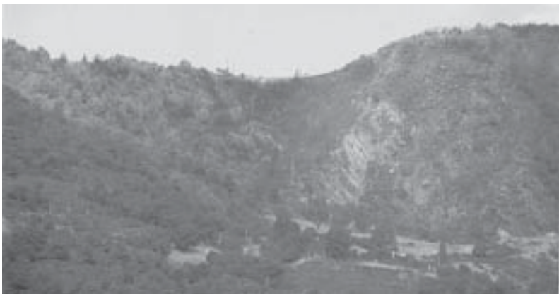
Incendio Plataci

Plataci. Quest'anno, i piromani hanno fatto un po' di ritardo, mettendo fuoco a fine estate, nelle sterpaglie che precedono il paese. Le fiamme stavano per raggiungere la Madonna della Montagnola.