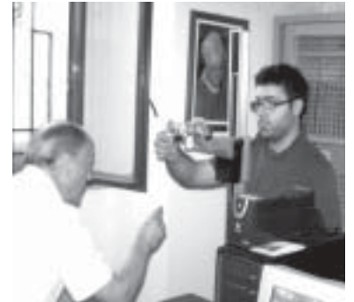
Nell'Archivio Diocesano di Cassano Jonio