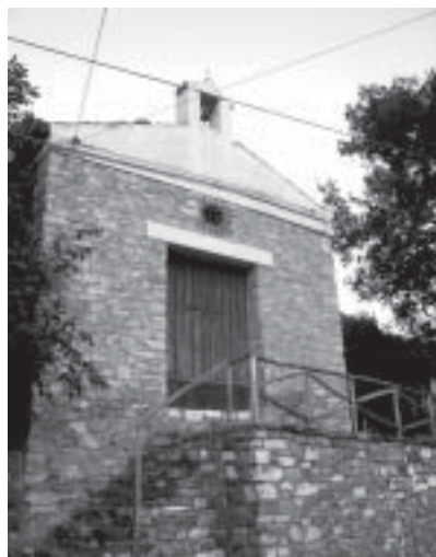
Una chiesetta di S. Lorenzo