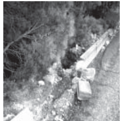
Sulla via di Mostarico

Dopo il terremoto d'Abruzzo, e anche per la disastrosa frana di Messina, la sezione regionale dell'Atcap (Associazione Tecnico-Economica-Calcestruzzo Preconfezionato) sostiene che in Calabria, il calcestruzzo ha pochi impianti in regola. Il Ministero delle Infrastrutture dichiara che queste disposizioni sono obbligatorie. Ci vuole la certificazione FPC del calcestruzzo. (d.m. del 14/01/2008).